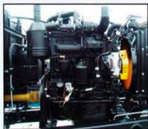
Дизельный двигатель Д-245.5 мощностью 65 кВт

Указанные комплектации самоходной косилки-плющилки «Мещера Е-403» дают возможность применять её для скашивания зелёных однолетних и многолетних трав с одновременной укладкой срезанной массы в валок или расстил на стерне, а также для скашивания и укладки срезанной стеблевой массы зерновых, колосовых культур и семенных трав в одинарный или двоярный с двух проходов валок при уборке раздельным способом.