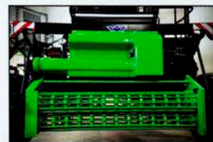
Е-313 Плющилка (1,8 м)

ускоренное просушивание скошенной массы, сокращается время сушки, в результате значительно повышается качество скошенных культур