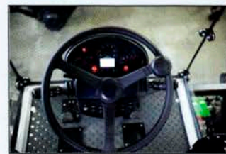
Регулируемая рулевая колонка

Современная эргономичная кабина Кондиционер Кабина с панорамным остеклением